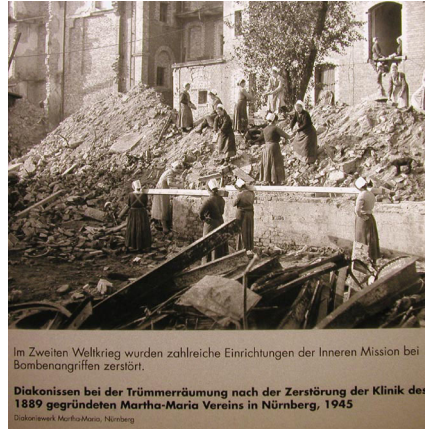
Im Zweiten Weltkrieg wurden zahlreiche Einrichtungen der Inneren Mission bei Bombenangriffen zerstört.